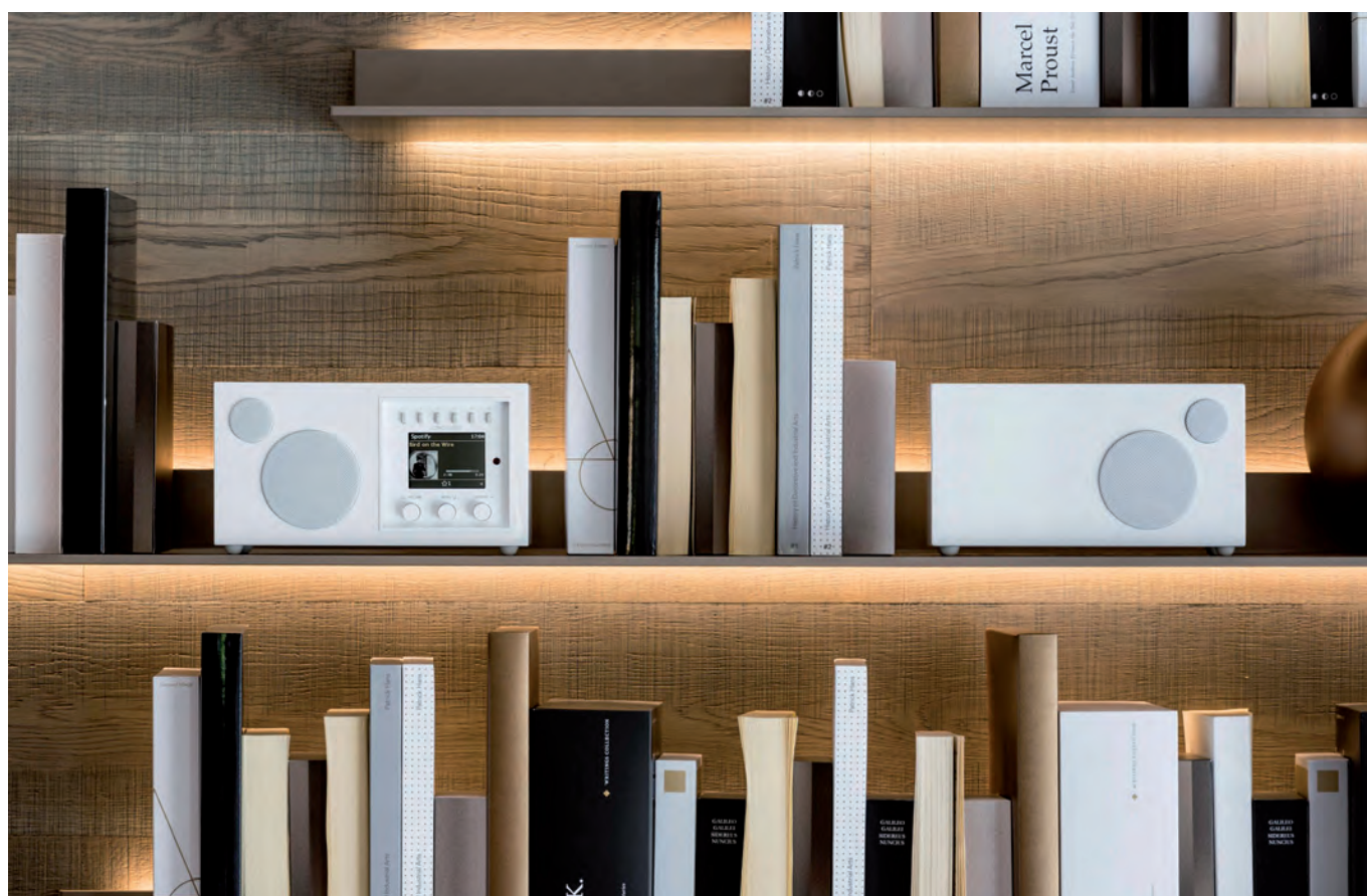
Solo, la Radio Smart Speaker dalle dimensioni compatte abbinata ad Ambiente, il diffusore che la rende stereofonica raddoppiandone anche la potenza, che passa da 30W a 60W RMS.

Duetto è stereofonica, con una potenza di 2X30W, in grado di sonorizzare piacevolmente anche ambienti importanti. Le finiture sono nero o bianco laccato, noce o hickory (in foto).