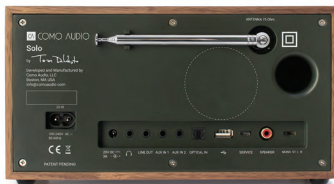
Amplio il parco connessioni. Cuffia, un ingresso e due uscite analogiche, un ottico, USB e uscita per lo speaker aggiuntivo. Notare il tubo di accordo basa-reflex e la grossa antenna per FM.