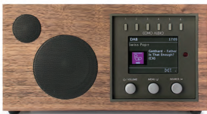
L'elettronica è comune a tutti i prodotti. Un ampio display a colori con 6 tasti scorciatoia in alto e tre manopole push per governare tutte le funzioni.