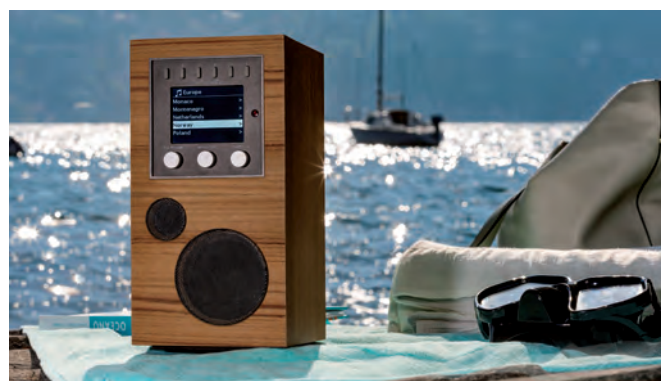
Amico la Radio Smart Speaker resistente all'umidità e dotata di batteria con 8 ore di autonomia. È rifinita in teak impregnato