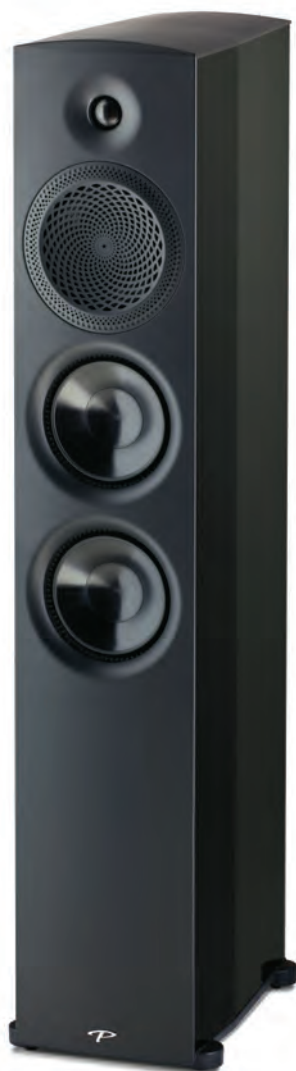
Premier 800 con 2 woofer da 16,5 cm, midrange e tweeter con lente acustica PPA rispettivamente da 16,5 cm e 2,5 cm. Molto alta l'efficienza, 92dB, che faciliterà parecchio l'interfacciamento con qualsiasi amplificatore.

Questi altoparlanti (fatta eccezione per il bookshelf Persona B) sono comuni a tutti i diffusori. I modelli 3F e 5F con a bordo il primo 2 e l'altro 3 woofer da 17,8cm a lunga escursione X-PAL con tecnologia Active Ridge. Si tratta di un componente a doppio centratore, uno subito sotto la cupola e l'altro dopo i ben tre magneti che supportano la lunga escursione dei componenti, che supera i 10 cm, e con un sofisticato circuito di ventilazione. Stessa struttura, seppure da 21,5 cm, per la 7F, che adotta 2 altoparlanti, mentre nel top di gamma 9H ne vengono utilizzati addirittura 4, in configurazione attiva. La "H" della sigla sta infatti per Hybrid. 2 i finali da 700W controllati da DSP che pilotano 2 woofer a testa e governati dal sistema ARC e dotati di microfono di taratura, mentre per la gamma media e alta si utilizzerà una amplificazione esterna. Appena sotto Persona la Serie Founder, che sostituisce il berillio con la ceramica AL-MAG. Midrange da 15,2cm e tweeter con guida d'onda sferica da 2,5cm entrambi con la stessa lente acustica di Persona, poi woofer in membrana al carbonio Carbon-X. 6 i modelli, tra i quali un interessantissimo booshelf, 40B, con un eccellente rapporto qualità/prezzo, e 3 da pavimento, 80F con 2 woofer da 15,2 cm 100F con 3 woofer da 17,7cm, e infine 120H, ibrida e dotata di sistema ARC