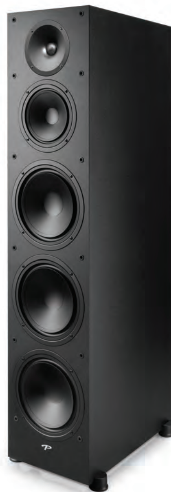
Monitor 8000 sono diffusori dall'incredibile rapporto qualità/prezzo. 95 dB di efficienza, 3 woofer da 20cm e midrange/tweeter con lente PPA da rispettivamente 16,5 cm e 2,5 cm entrambi in carbonio.

premio EISA come miglior diffusore da pavimento. Dei due centrali a catalogo, mentre uno è di tipo tradizionale, il 90C, il 70LCR può essere utilizzato per i canali laterali o come centrale, e installato in verticale o in orizzontale. Eccellente rapporto qualità/prezzo la Serie Premier, tweeter X-PAL da 2,5cm in alluminio con lente acustica e sia midrange che woofer con cono in carbon-polipropilene. Due modelli da scaffale, 100B e 200B con mid-woofer da rispettivamente 14cm e 16,5cm, e due modelli da pavimento, 700F e 800F con una coppia di woofer cadauno, da 14cm il primo e 16,5 cm il secondo. Completano la serie i centrali 500C e 600C. Poi la serie Monitor SE, componenti simili alla Premier ma con dimensioni diverse e finiture più semplici. SE Atom da scaffale con woofer da 14cm, SE 3000F, SE 6000F e SE 8000F da pavimento tutti con midrange da 14 cm e 2 woofer sempre da 14cm il primo modello, 3 il secondo modello e sempre 3 ma da 6,5 cm il top della gamma. Centrale abbinato SE 2000C. Molti i subwoofer a catalogo. Il SUB 2 Signature, al top della gamma, e tra i più potenti mai costruiti, ma molte sono le chicche. Seismic per esempio, dalla forma molto particolare e con avanzati contenuti tecnici.